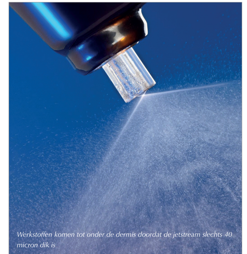
Werkstoffen komen tot onder de dermis doordat de jetstream slechts 40 micron dik is

De biofeedback banen verzwakken helaas in de loop der jaren, waardoor de vitaliteit van de cellen en organen verzwakt. Vooral de huid, de gelaatsspieren, de haarfollikels, de geslachtsorganen en de gevoeligheid van vingertoppen zien hun biofeedback afnemen. Levensnoodzakelijke cellen en organen daarentegen behouden hun vitaliteit tot op hoge leeftijd. Het is mogelijk om deze verzwakte spieren een oppepper te geven door middel van plaatselijke stimulatie. De nieuwe biofeedback stimulatiemethode is een natuurlijk en weinig intensieve manier om deze spieren te trainen. Dit principe wordt vanaf nu dus ook gebruikt in huidverbetering in de vorm van een Superboost-behandeling.