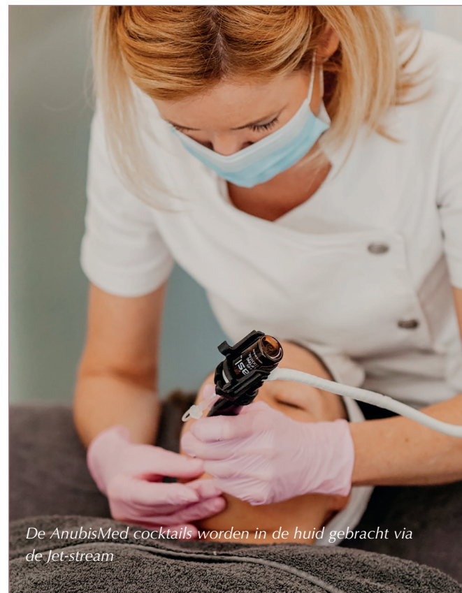
De AnubisMed cocktails worden in de huid gebracht via de Jet-stream

De Superboost-behandeling begint met de Jet-stream. De AnubisMed cocktails, samengesteld naar de noden van de huid, worden in de huid gebracht via een naaldloze injectie (de Jet-stream), terwijl het diepere, overtollige vuil uit de poriën wordt gehaald. Dit wordt ook wel 'no-needle follicular infusion' genoemd. De techniek berust op een ultrafijne straal die uit het infusie-apparaat, rechtsreeks in de haarfollikels, talgklieren en zweetkanalen belandt. Van daaruit verspreiden de gespecialiseerde AnubisMed cocktails zich in de diepere lagen van de huid waar het zijn werking kan uitoefenen. De werkstoffen komen zelfs tot onder de dermis terecht doordat de jet-stream slechts 40 micron dik is. Ter vergelijking: de poriën in onze huid zijn 70 tot 100 micron dik en zelfs de dunste naald heeft een dikte van 300 micron. Het gebruik van deze ultradunne jet-stream is uniek in de markt.